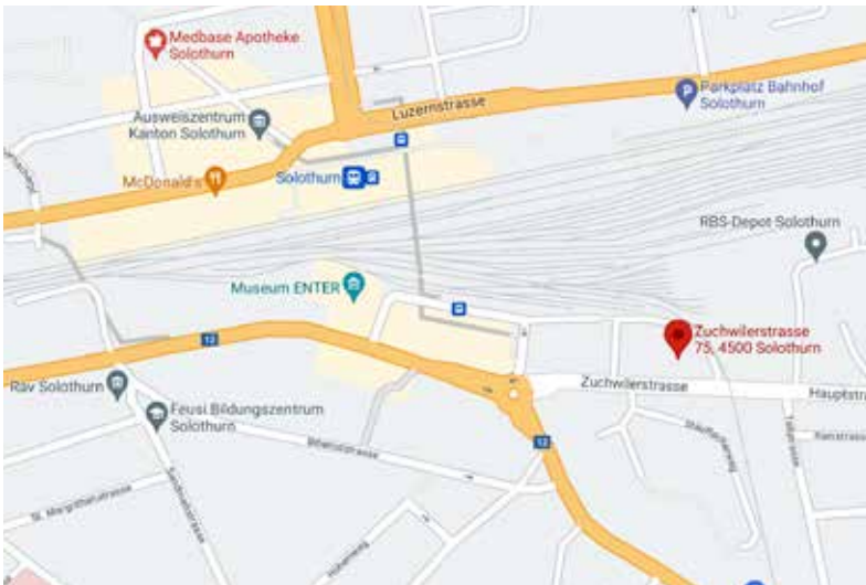
Standort Solothurn Zuchwilerstrasse 75, 4500 Solothurn