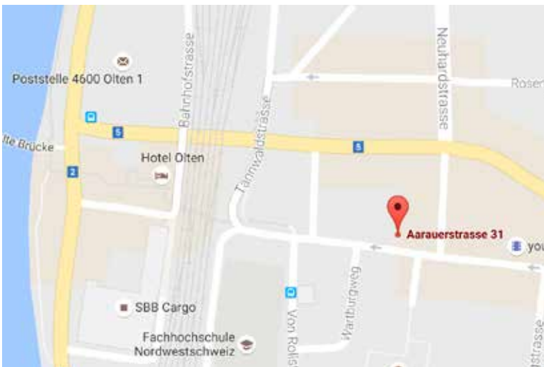
Standort Olten Aarauerstrasse 31, 4600 Olten

pro Lektion nur Fr. 7.- Alphakurs nur Fr. 3.- pro Lektion